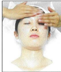
⑤ニュートラル塗布

肌のPHバランスを 整えるために ニュートラルローションを 塗布し、お肌のきめを 整えます。