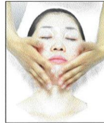
⑥ビタミンC誘導体塗布

古い角質をケアし、 ビタミンC誘導体を たっぷり塗布することにより お肌の再生に必要な ビタミンを補給します。